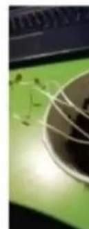
9 dienos po pasodinimo

šios išaugo, nes buvo tinkama temperatūra, turėjo vandens šviesos, anglies dioksido – galėjo vykdyti fotosintezę.