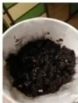
Dvi dienos po pasodinimo