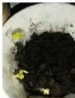
3 dienos po pasodinimo