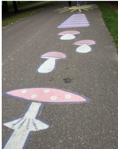
Aktyvusis takelis Alytaus Jaunimo parke - fizinį aktyvumą skatinančios viešosios erdvės pavyzdys