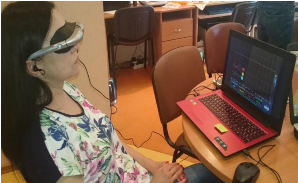
Keičiantis patirtimi buvo pristatyti nauji metodai

Šio projekto dalyviai (tarp jų ir neįgalių vaikų tėvai) pabrėžė glaudaus bendradarbiavimo ir abipusės paramos svarbą kaip sėkmingo vaiko vystymosi sąlygą. Nustatytos Alytaus ir Gižycko tėvų bendravimo ir bendradarbiavimo galimybės, taip pat tėvų galimybės kurti organizaciją, vienijančią Alytaus miesto autizmo spektro sutrikimų turinčių vaikų šeimas. Pasikeitus patirtimi, pasibaigus projektui buvo įkurta Alytaus autizmo asociacija.