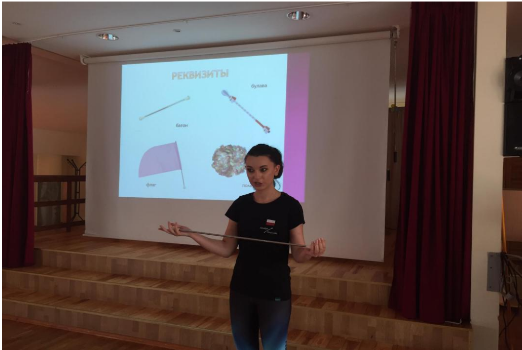
Asociacijos „Majorette Mermaid Giżycko“ pristatymas apie majoretės prieinamumą žmonėms su įvairia negalia