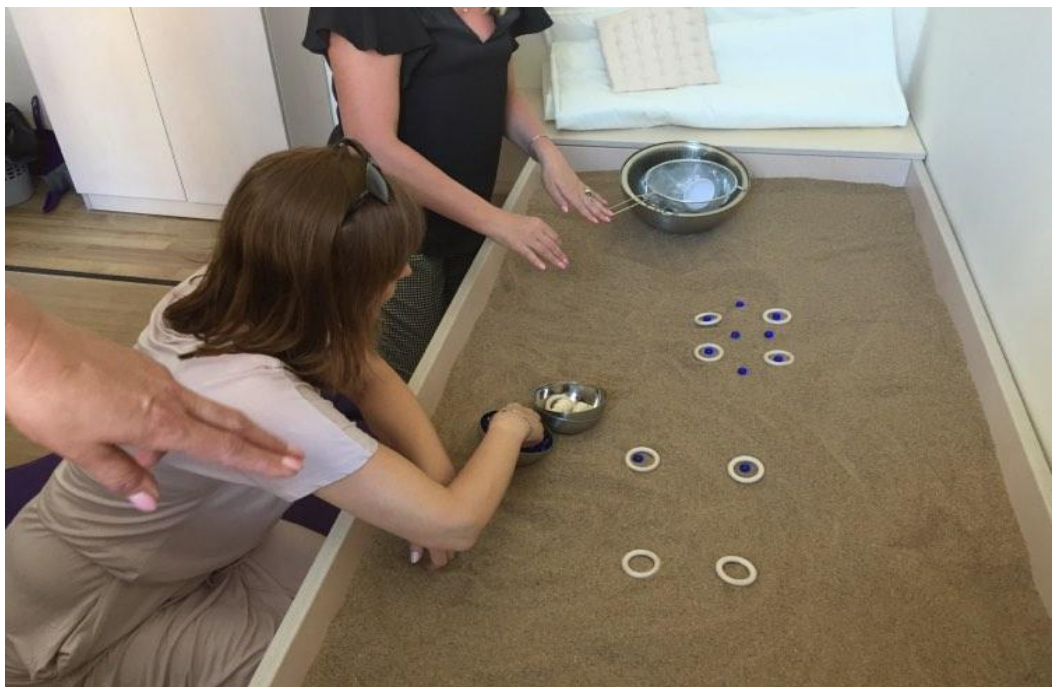
Alytaus Dzūkijos mokyklos pristatymas apie šilto smėlio metodo taikymą specialiųjų ugdymosi poreikių turinčių asmenų fizinei ir emocinei būklei gerinti