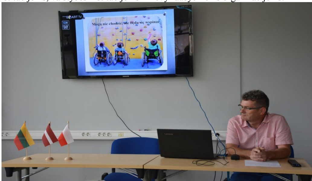
Giżycko asociacijos „Piżmakowe Wiewiory“ pristatymas apie galimybę organizuoti laipiojimo varžybas žmonėms su fizine negalia

Įgyvendinant šį projektą bendradarbiavo įvairios valstybinės institucijos ir nevyriausybines organizacijos. Jie pateikė sporto šakų, prieinamų neįgaliesiems, pavyzdžių, nurodė, kaip organizuoti tam tikros sporto šakos veiklą ir su kokiomis organizacijomis bendradarbiauti, kad neįgalieji turėtų kuo daugiau galimybių sportuoti. Įstaigų atstovai pateikė sporto renginių, kuriuos pavyko surengti pasitelkus daug partnerių, pavyzdžių. Bendradarbiaujant įvairioms institucijoms pavyko patikrinti Giżycko apskrities ir Alytaus uosto objektų prieinamumą žmonėms su negalia. Projekto metu susitikimų dalyviai sutarė, kad įgyvendinti parengtas rekomendacijas bus įmanoma tik bendradarbiaujant vietos valdžios institucijoms, valstybės institucijoms ir nevyriausybiniams organizacijoms.